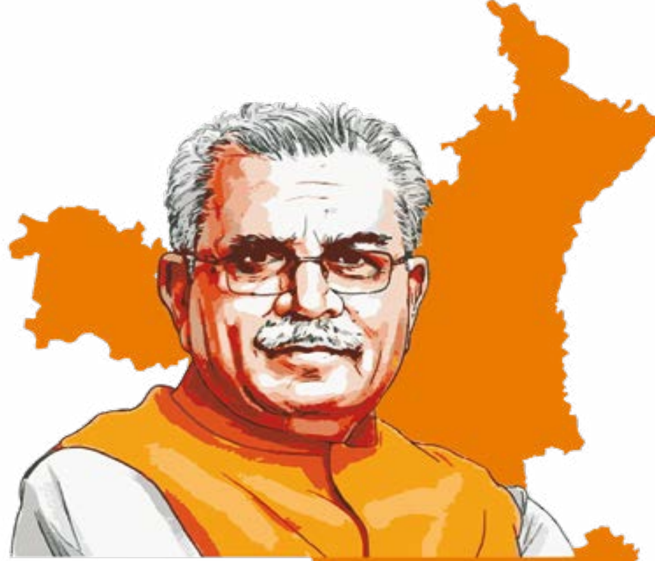
श्री मनोहर लाल मुख्यमंत्री