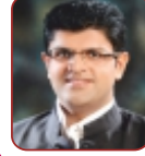
श्री दुष्यंत चौटाला उप मुख्यमंत्री

कमरा नं. 40/5, सचिवालय दूरभाष नं. 0172-2740212